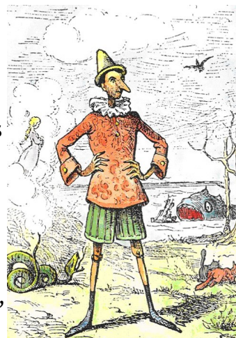
illustration originale d'Enrico Mazzanti - 1883

Mais ses lecteurs ont été horrifiés, ils ont écrit aux éditeurs, ils ont protesté, et Collodi repris l'histoire. Il a inventé la